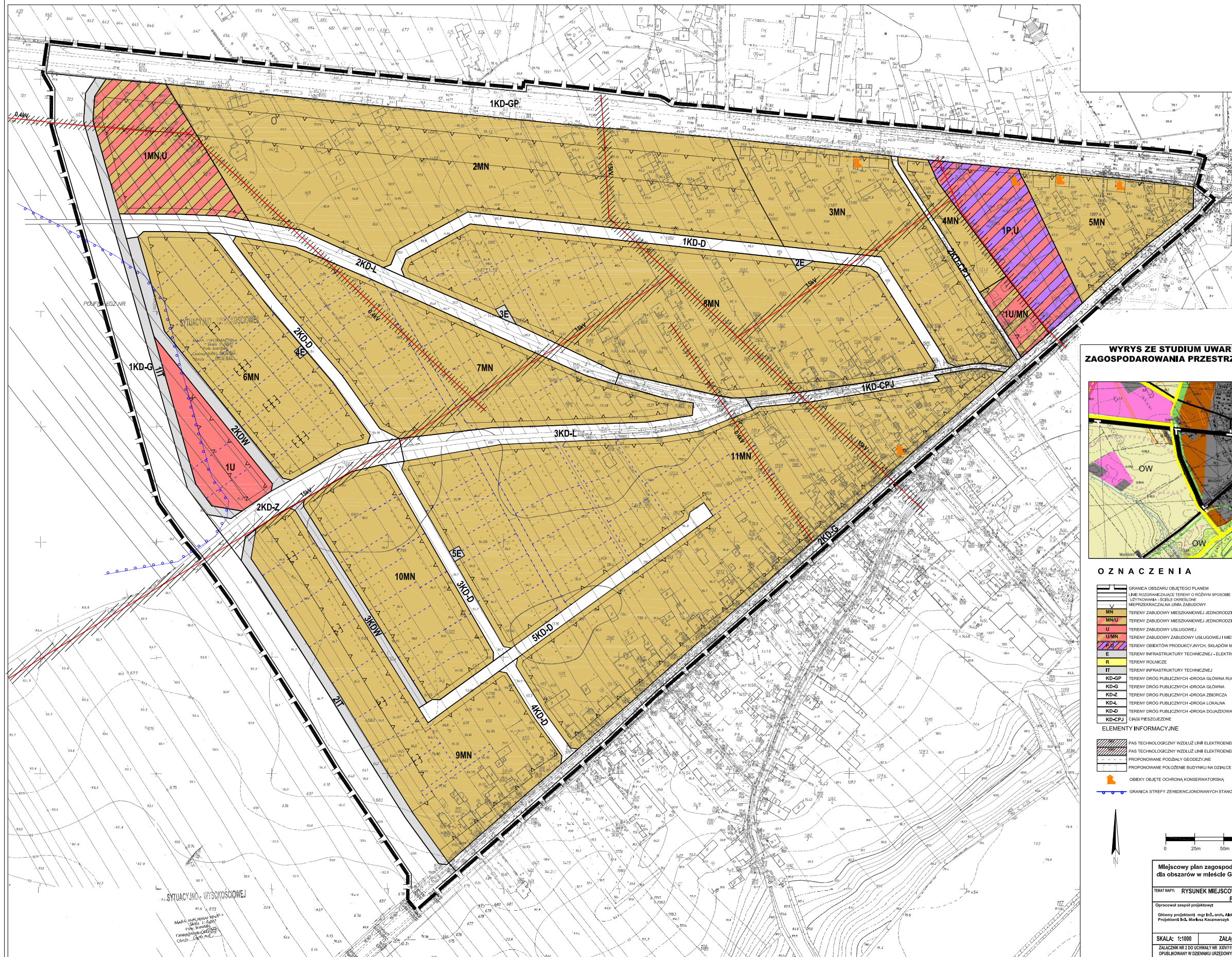
WYRYS ZE STUDIUM UWARUNKOWAŃ I KIERUNKÓW ZAGOSPODAROWANIA PRZESTRZENNEGO GMINY GOLINA SKALA 1:10000